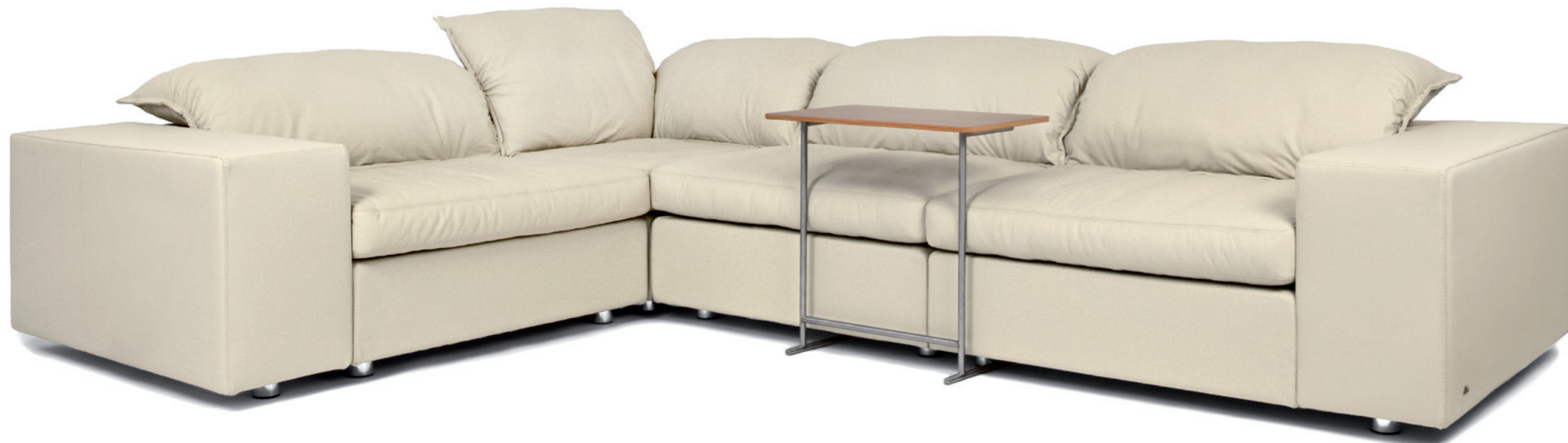
sedáčka s originálním stolem

Pulvino je nízká sedáčka, které esteticky i funkčně dominuje polštář jako symbol odpočinku. Pohodlí zajišťují měkké materiály sedáků i polohovatelná opěradla ve tvaru polštářů.