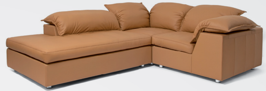
Pulvino ukončené rohovým prvkem