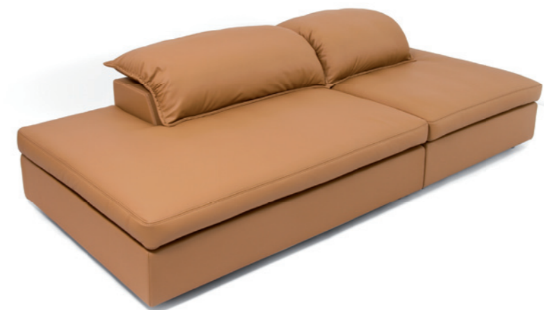
netradičně pojatá sedáčka z ukončovacích dílů

Pulvino tvoří pevná dřevěná kostra, obalená tenkou vrstvou studené pěny. Na ni položené podušky opěradel a sedáků pak dotváří tento celek umožňující dokonalé uvolnění. Sedáky jsou šity komůrkovým způsobem – měkká výplň dutého vlákna tak zůstane dlouho na svém místě. I když si budete Pulvino často užívat, neztratí nic z původní krásy.